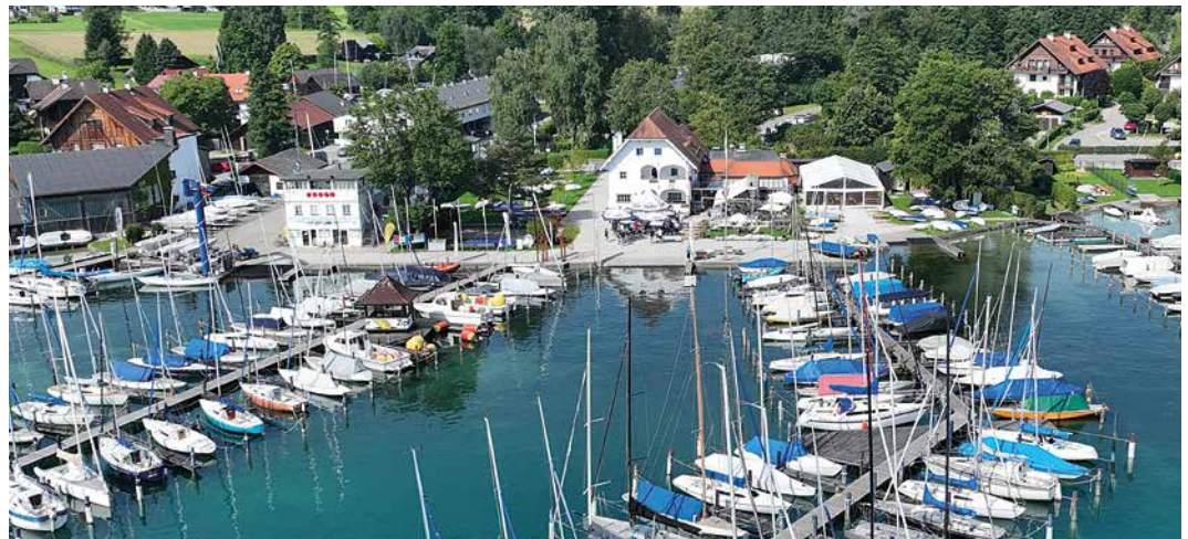
Union-Yacht-Club Attersee. Das seeseitige Clubgelände des UYCA im Sommer 2023 mit zwei seiner vier Stege vom Wasser aus gesehen – im Hintergrund der Starterturm und das Clubhaus

Wir wünschen allen Regatta- teilnehmer*innen einen angenehmen und erfolgreichen Aufenthalt im Union-Yacht-Club Attersee