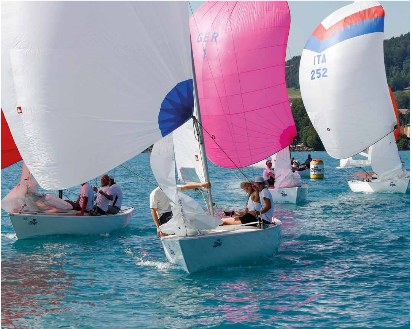
Internationales Feld. Nach dem Runden der „Zipferboje“ geht es unter Spi auf Vorwindkurs